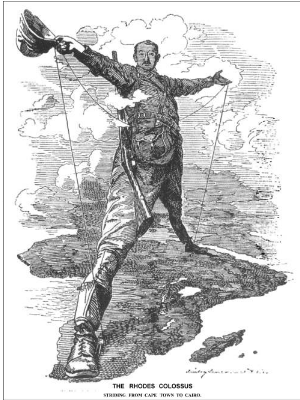
Spotprent in het Engelse tijdschrift Punch uit 1892 over Cecil Rhodes' droom: de spoorweg van Kaapstad tot Cairo

het noorden, van Zuid-Afrika naar Rhodesië (vandaag Zimbabwe en Zambia), en liet zijn oog ook op Katanga vallen, waarvan ondertussen geweten was dat het veel bodemschatten had. De krant The Times suggereerde dat de drie grote Britse bedrijven, de Royal Niger Company, de British East Africa Company en de British South Africa Company elkaar in het hart van Afrika zouden kunnen ontmoeten. Cecil Rhodes droomde er zelfs van een spoorverbinding aan te leggen tussen Kaapstad en Cairo, uiteraard alles over Brits gecontroleerd grondgebied (deze spoorweg werd later grotendeels gerealiseerd; alleen het deel Soedan-Oeganda ontbreekt vandaag nog).