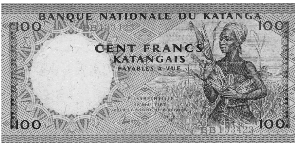
100 frank Katanga, 136 x 65 mm, tweede serie 1962, gedrukt door Johan Enschede en Zonen, Nederland