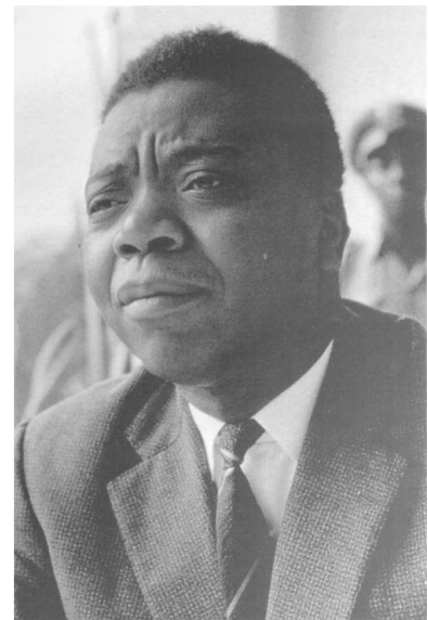
Moïse Tshombe (1919-1969)

Zo werd Congo onafhankelijk op 30 juni 1960, totaal onvoorbereid. Joseph Kasavubu werd president en Patrice Lumumba eerste minister, twee rivalen uit verschillende politieke partijen waartussen het niet boterde. Lumumba predikte het unitarisme waardoor de rijkdommen van de welstellende provincies ook de rest van Congo ten goede zouden komen, en toonde zich voorstander van verregaande sociale hervormingen. Hij was een idealist die geloofde dat Congo alles in eigen handen kon nemen en er welvaart kon komen mits de Belgen maar buiten te gooien. Eigenlijk totaal onrealistisch want daar waren nauwelijks mensen voor opgeleid. Dat alles belandde in het verkeerde keelgat bij vele westerse landen en hij werd als communist afgeschilderd en tegengewerkt. In de weken na de onafhankelijkheid staakte de politie reeds die wilde dat de Belgische officieren buitengegoid werden.