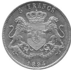
5 F 1894 Leopold II, Congo-Vrijstaat

In de 19 de tot het begin van de 20 ste eeuw circuleerden in Katanga en omliggende gebieden de welbekende katangakruisen als ruilmiddel, omdat de lokale bevolking de kopermijnen reeds kende en uitbaatte. Deze katangakruisen zijn het symbool van Katanga gebleven tot op heden. Ze werden langzaam vervangen door de munten van de Congo-Vrijstaat die vanaf 1887 geslagen werden.